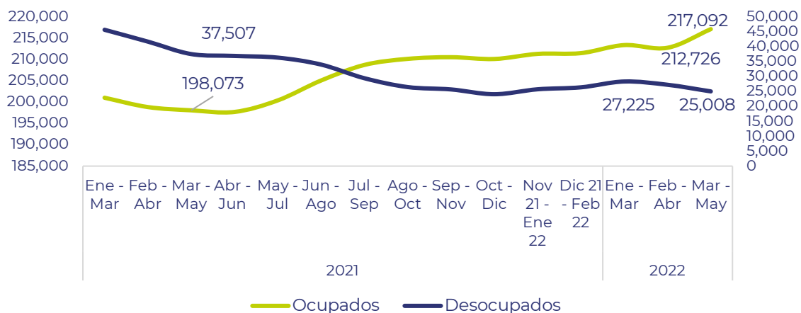
Número de ocupados y desocupados en Manizales A.M. 2021-2022

Manizales A.M. registró 217 personas ocupadas y 25 mil personas en condición de desempleo en el trimestre móvil marzo-mayo del 2022. La comparación con el mismo trimestre del 2021 deja ver un panorama alentador, con un crecimiento de 19 mil personas en la ocupación (9,6%) y un poco más de 12 mil personas que salieron del desempleo (-33%).